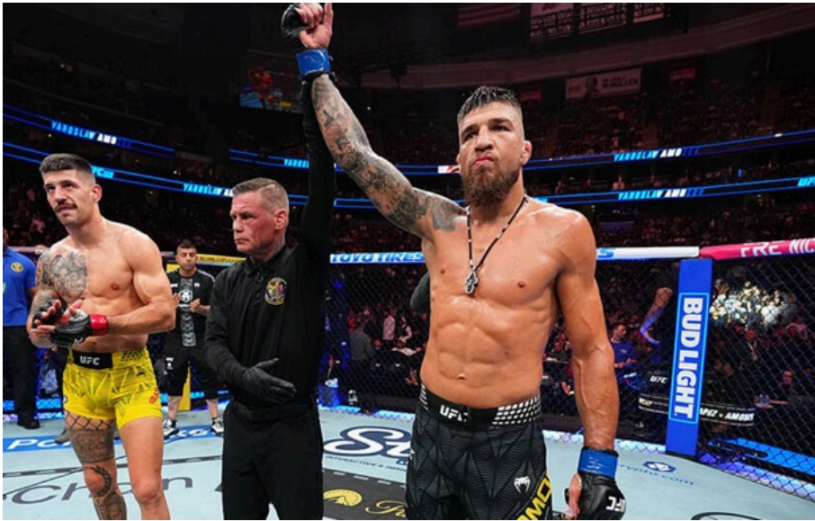
Амосов - Альварес

Амосов підкорює UFC: ефектна перемога над Хоелем Альваресом зміцнює позиції українця.