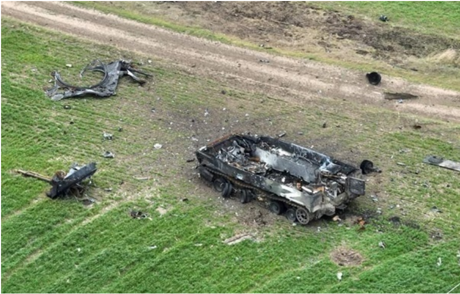
За добу армія Росії втратила 840 військових

Минулої доби ЗСУ ліквідували 840 окупантів. Знищено три бронемашини, 75 артсистем, дві РСЗВ, два засоби ППО, 11 НРК і 1489 дронів.