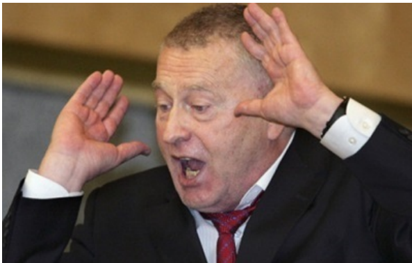
При цьому, Жириновський нічого не сказав про Калінінградську область, Карелію та інші "споконвічні" російські території