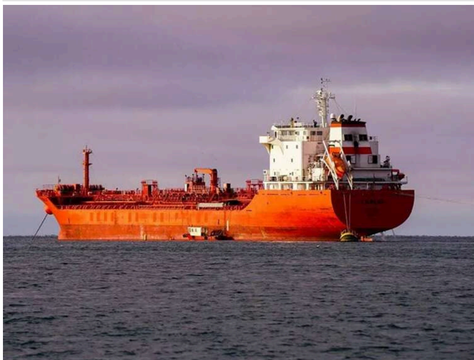
Світова торгівля на паузі: через Ормузьку протоку за добу не пройшло жодне судно

Згідно з даними сайту MarineTraffic, за останні доби через Ормузьку протоку не пройшов жоден комерційний корабель.