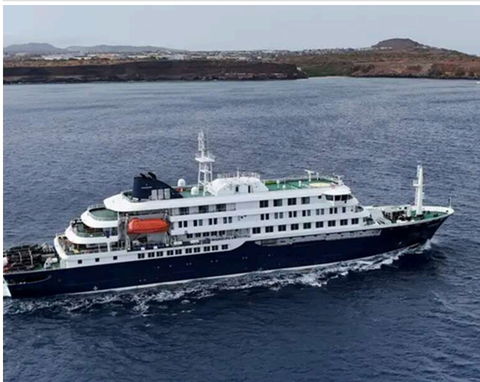
Суд Мадрида зобов'язав пасажирів судна "MV Hondius" пройти примусову ізоляцію через загрозу хантавірусу

Іспанців, які мандрували на судні "MV Hondius" і могли контактувати з хантавірусом, зобов'язали пройти примусову ізоляцію. Таке рішення ухвалив суд у Мадриді за запитом уряду.