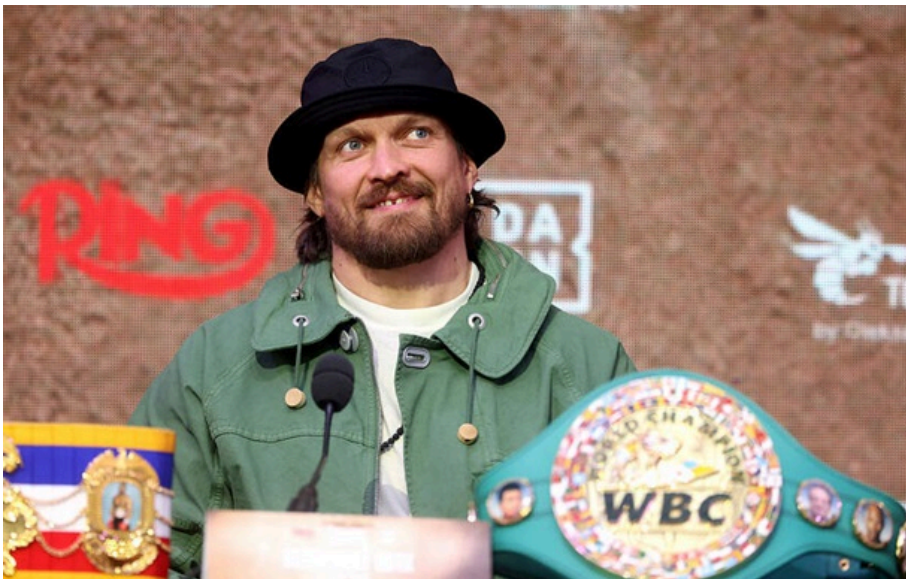
Олександр Усик

Український важкоатлет висловив готовність провести бій із Тайсоном Ф'юрі, який шукає гідного суперника.