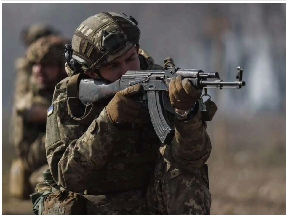
Ситуація на фронті: Зафіксовано 51 боєзіткнення, з них 30 - на Покровському і Гуляйпільському напрямках