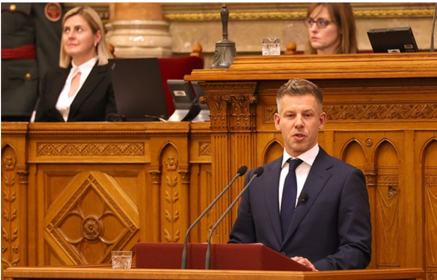
Петер Мадяр став новим прем'єром Угорщини

Тиса здобула перемогу на виборах, отримавши дві третини мандатів у парламенті - 141 місце.