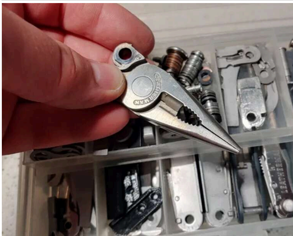
«Спортивні аксесуари» виявилися Leatherman: у Києві суд конфіскував посилку із запчастинами до мультитулів