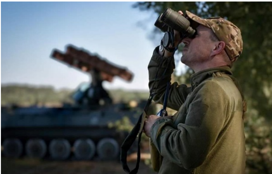
Ніч на 9 травня минула більш-менш спокійно