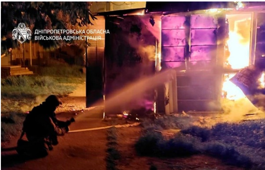
Ліквідація наслідків російського обстрілу на Дніпропетровщині