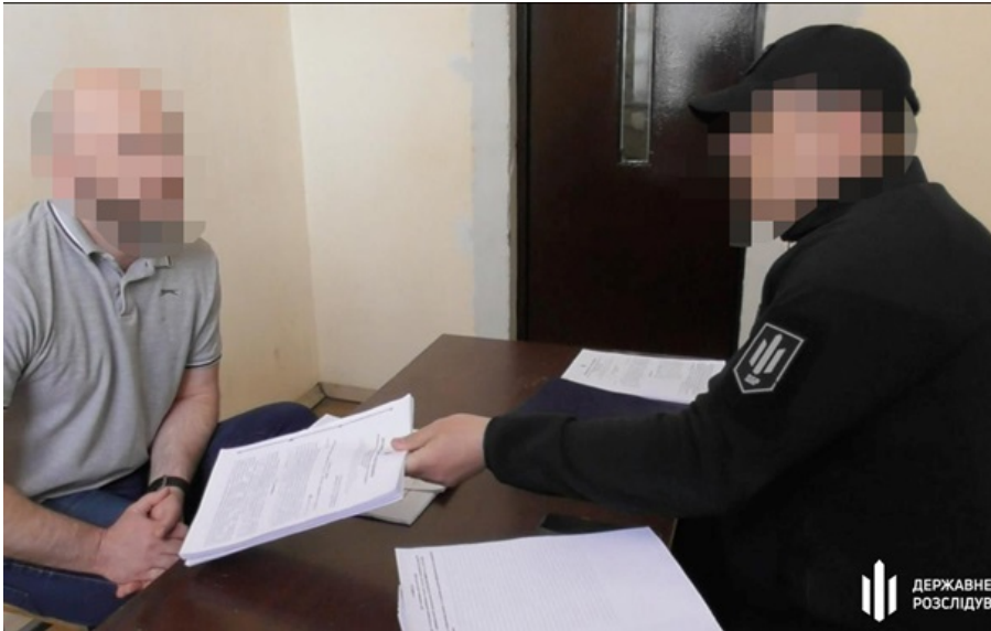
ДБР викрило організовану схему із квартирами померлих у Києві та Одесі

Загальна вартість нерухомого майна, яким заволоділа злочинна організація склала 7,64 млн грн. Ще одну квартиру у Києві, вартістю у 2 млн грн, фігуранти не встигли остаточно переоформити.