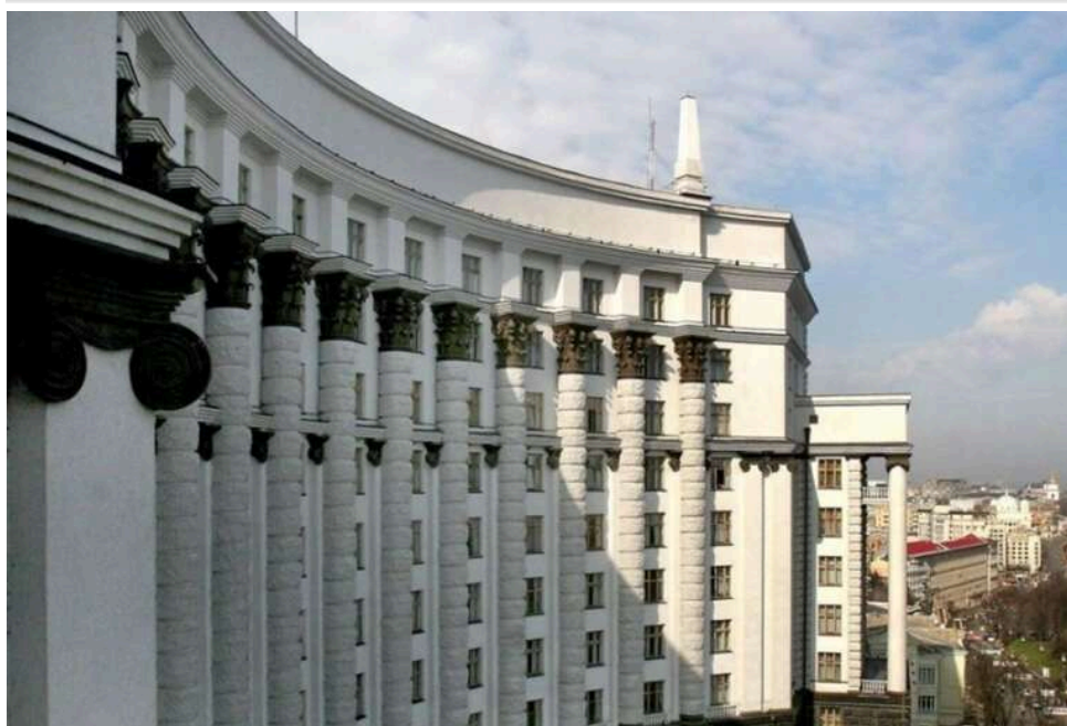
Кабмін пропонує збільшити оборонні видатки бюджету-2026 на 1,5 трильйона гривень

Кабмін пропонує підвищити витрати на оборону та безпеку в бюджеті-2026 на 1,56 трлн гривень, повідомила прем'єрка Свириденко.