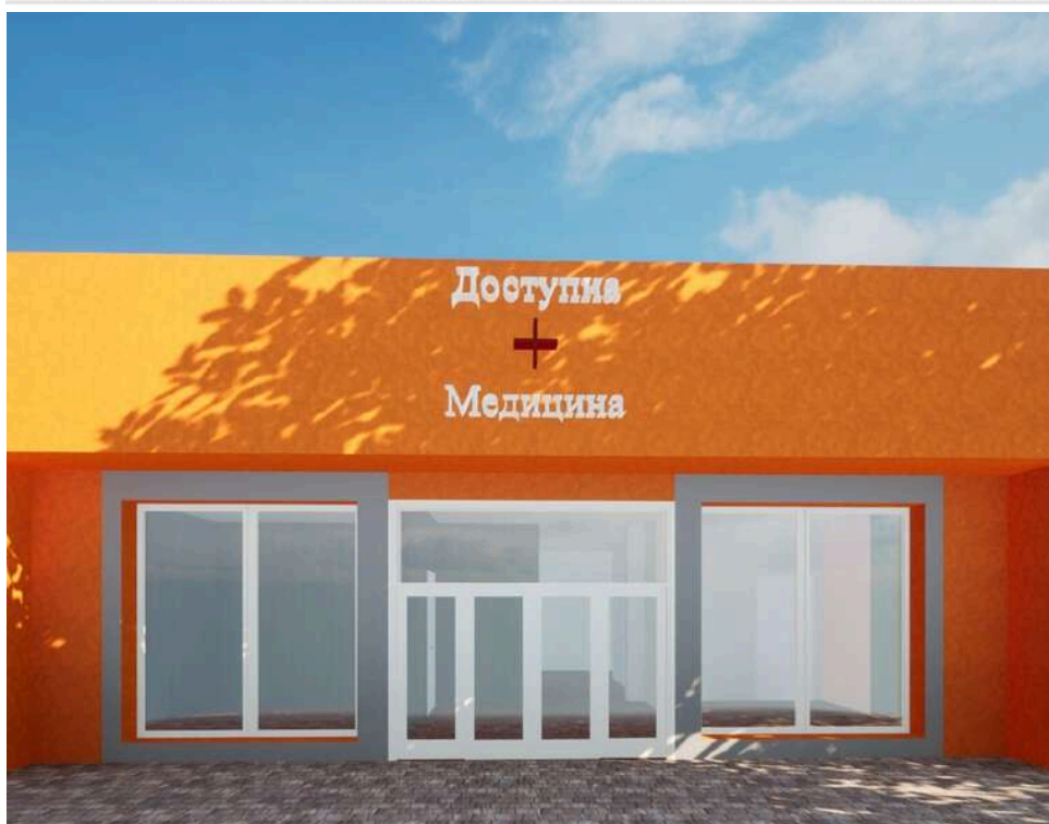
Амбулаторія з «золотим» асфальтом: у Данилівці на будівництві медзакладу знайшли переплату в 2 мільйони гривень

У селі Данилівка на Київщині будуть амбулаторію з укриттям. Управління економічного розвитку, житлово-комунального господарства, капітального будівництва та інфраструктури Калинівської селищної ради уклало вже третій договір на зведення медичного закладу – знову з ТОВ «Вишпостач». Вартість робіт може скласти 44,7 млн грн. Завершити будівництво планують до кінця 2026.