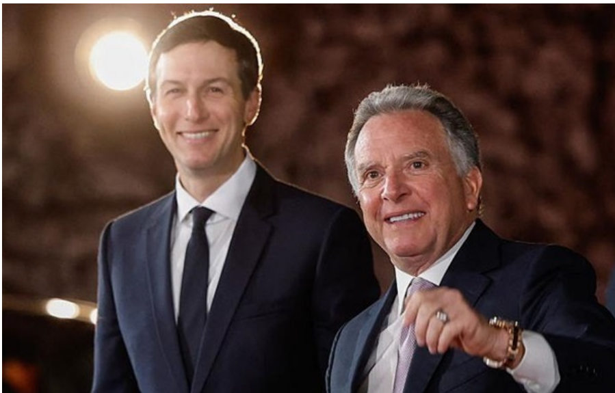
Джаред Кушнер і Стів Віткофф ніяк не доїдуть до Києва

Наразі доопрацьовуються деталі домовленостей, які можуть гарантувати безпеку, зазначив президент.