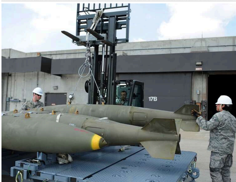
США майже втричі збільшують експорт зброї союзникам на Близькому Сході