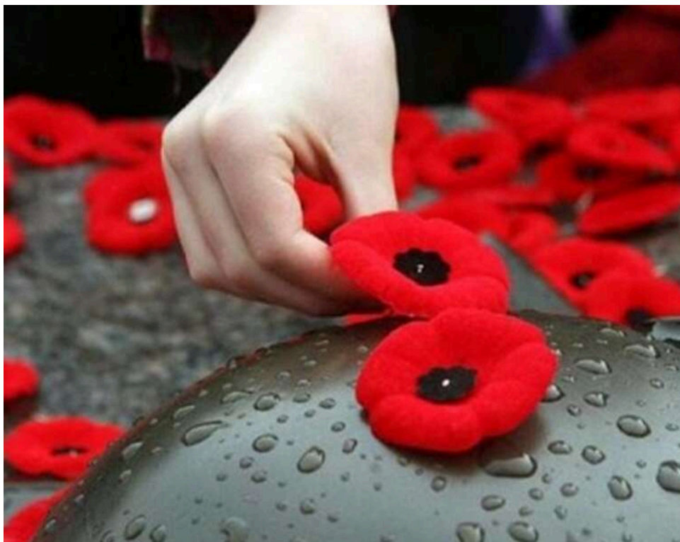
Україна відзначає День пам'яті та перемоги над нацизмом: чому 8 травня стало єдиною датою вшанування

Сьогодні, 8 травня, Україна відзначає День пам'яті та перемоги над нацизмом у Другій світовій війні 1939–1945 років.