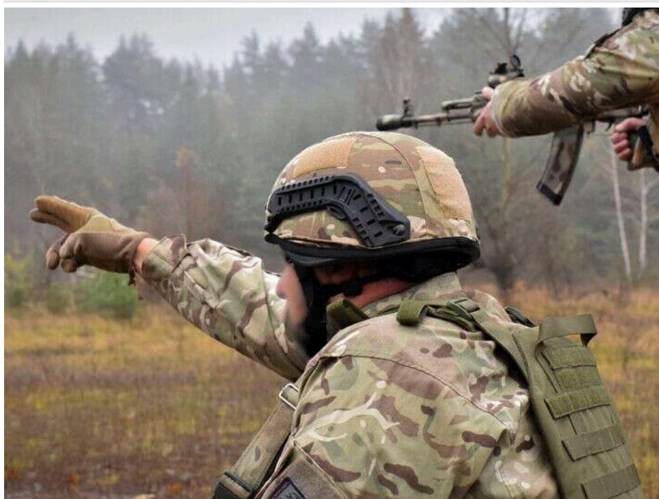
Ситуація на фронті: Зафіксовано 208 боєзіткнень, РФ найбільше атакувала на Покровському та Гуляйпільському напрямках

За 7 травня Сили оборони України зафіксували 208 бойових сутичок із російськими окупантами.