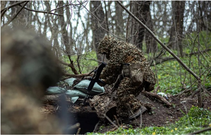
Українські оборонці за минулу добу знищили 17 бронемашин та 91 артсистему ворога

Загальні втрати Російської Федерації за більш як чотири роки війни проти України склали 1 339 190 військових її армії.