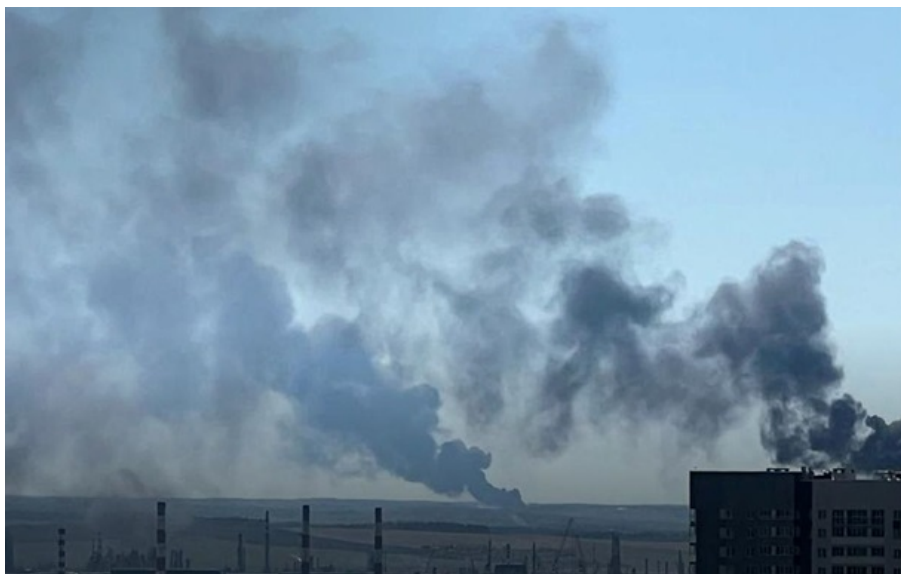
ЗСУ знову уразили енергооб'єкти в Пермі

Росія відмовилася від переговорів з Україною; дрони знову уразили енергооб'єкти в Пермі. Кореспондент.net виділяє головні події вчорашнього дня.