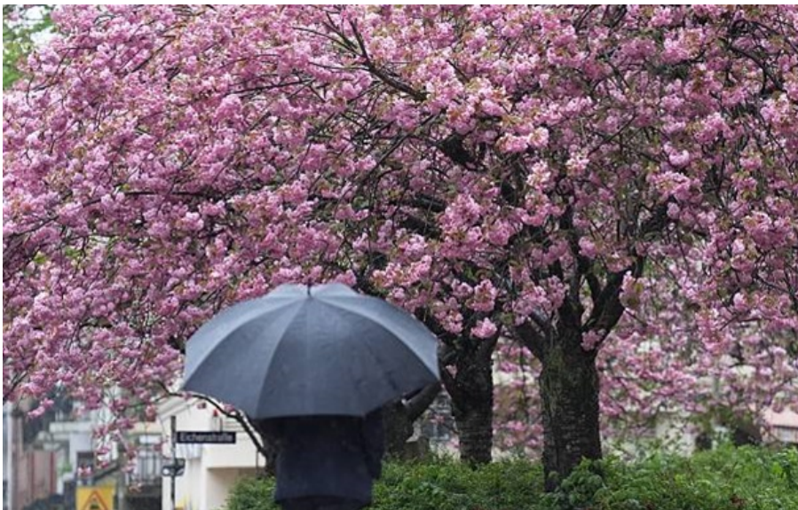
Дощитиме, але не скрізь

В Україні спостерігається зниження температури повітря, спека відступає, а атмосферні фронти принесли дощову погоду.