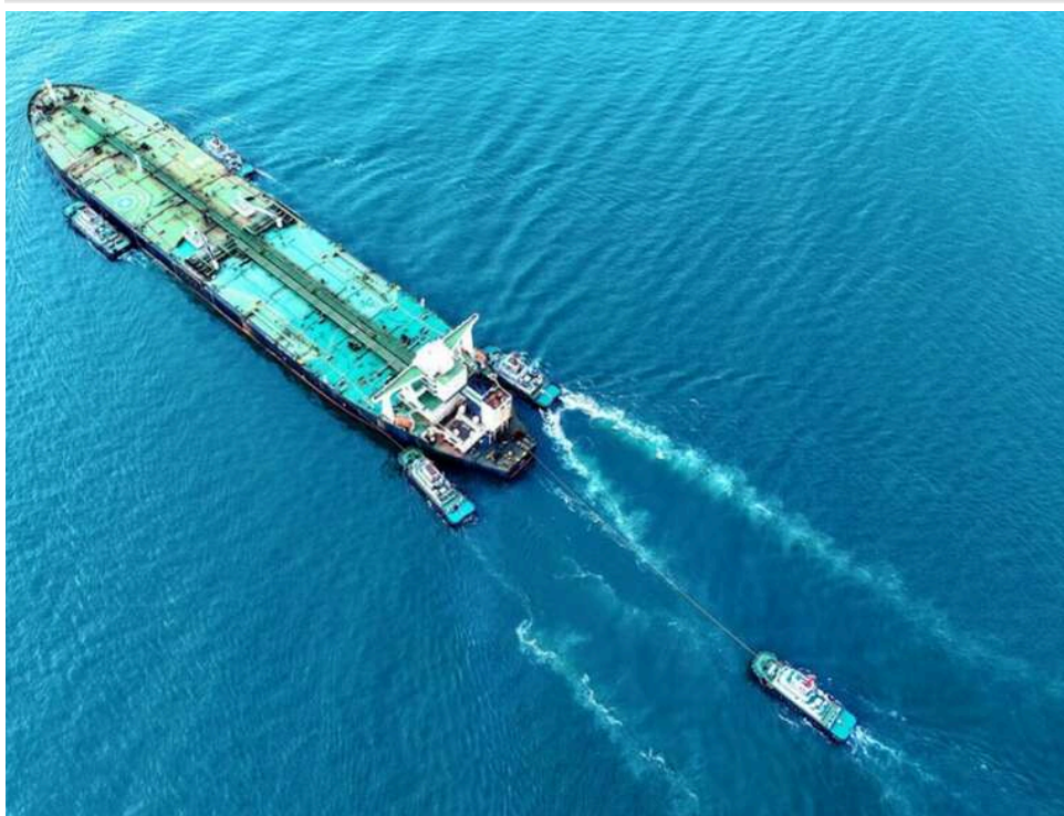
Нафта в режимі "невидимки": танкери ОАЕ таємно проривають блокаду Ормузької протоки з вимкненими транспондерами

Дірчава блокада: танкер ОАЕ непомітно проходять через Ормузьку протоку, – Reuters.