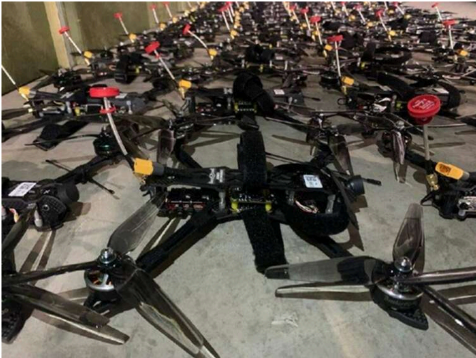
Кінець китайської монополії: Україна масово переходить на тайванські деталі для виробництва дронів

Україна шукає заміну Китаю: Тайвань перетворюється на ключового постачальника компонентів для дронів – The Guardian.