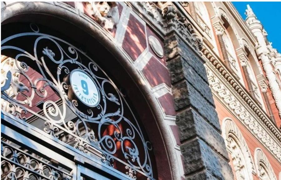
Міжнародні резерви України за місяць зменшилися на 7,3%

Обсяг резервів залишається достатнім для збереження стійкості валютного ринку, запевнили у Нацбанку.