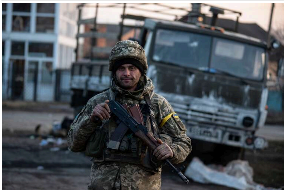
Ситуація на фронті: ворог 52 рази атакував позиції Сил оборони, найбільше боїв на Покровському напрямку

З початку доби 7 травня агресор 52 рази атакував позиції Сил оборони України.