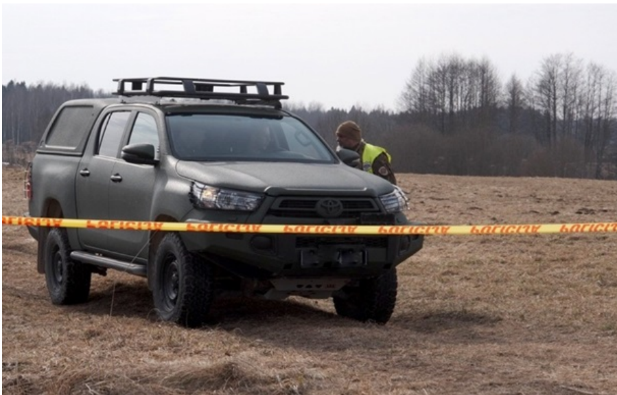
Латвія розслідує "приліт" дронів з Росії

У Латвію з території Росії залетіли безпілотники, один з них влучив у нафтові резервуари. Влада країни розпочала розслідування і скасувала навчання для дітей.