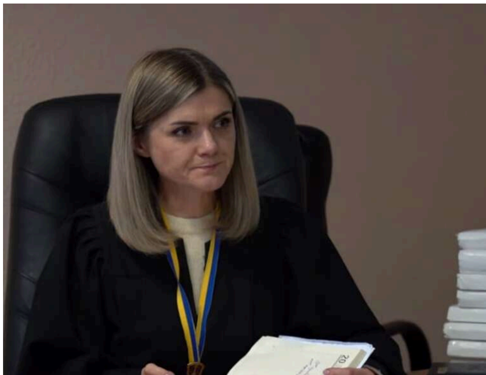
67 тисяч доларів «під подушкою»: суддя Київського окружного адмінсуду Альона Кушнова показала свої статки

Суддя Київського окружного адміністративного суду Альона Кушнова вказала в декларації квартиру в Києві площею 76 м 2 та значну суму готівки в доларах.