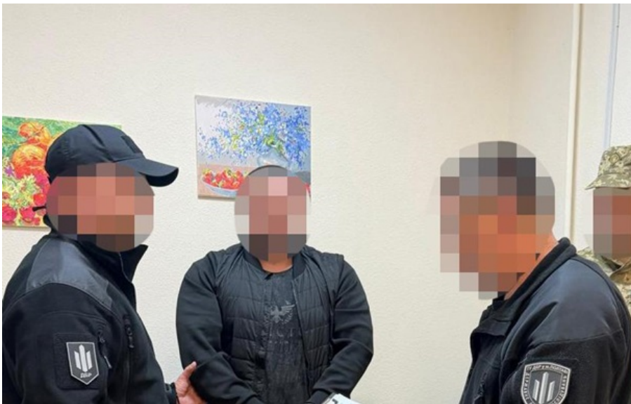
Зловмиснику "світить" до 12 років позбавлення волі

Зловмисник мав найнижче військове звання і статус, але намагався встановити серед особового складу власні "порядки".