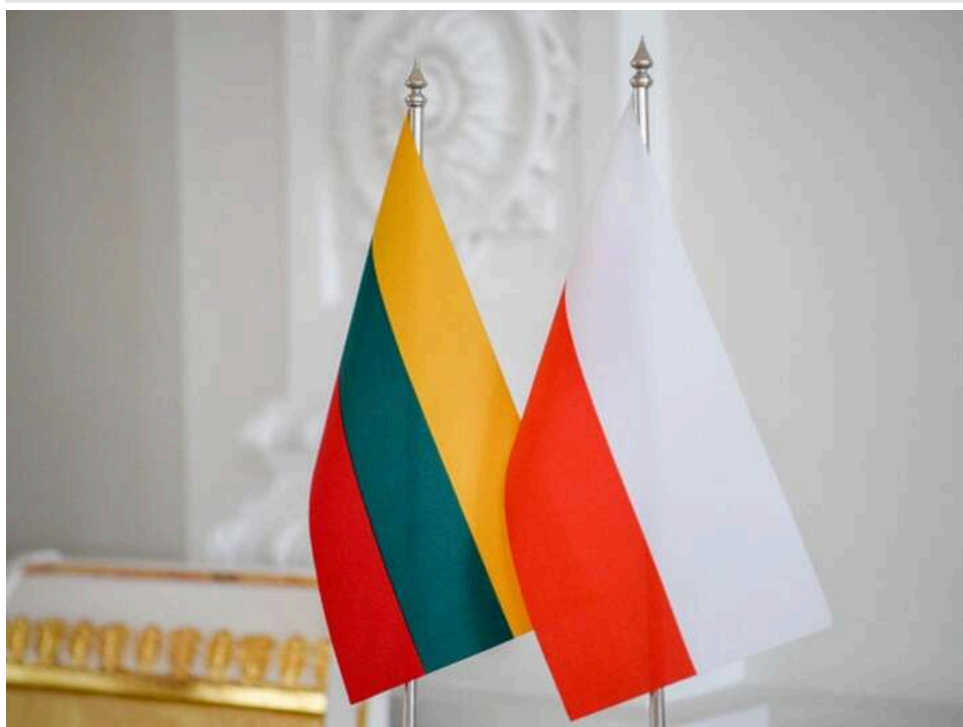
Польща та Литва заявили про готовність прийняти додаткові війська США в разі рішень Вашингтона

Польща та Литва офіційно підтвердили готовність розмістити на своїй території додаткові підрозділи армії США. Країни вже підготувала всю необхідну інфраструктуру для приймання військових і чекають сигналу від Трампа.