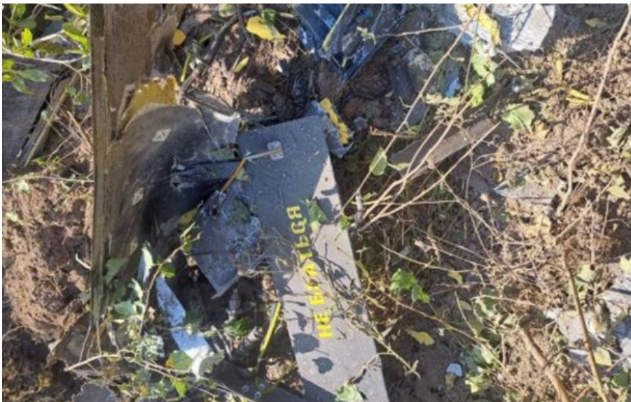
На місці події працюють служби екстреної допомоги (ілюстративне фото)

Один з дронів впав на вулиці, де розташоване нафтосховище в місті Резекне, а другий все ще шукають.