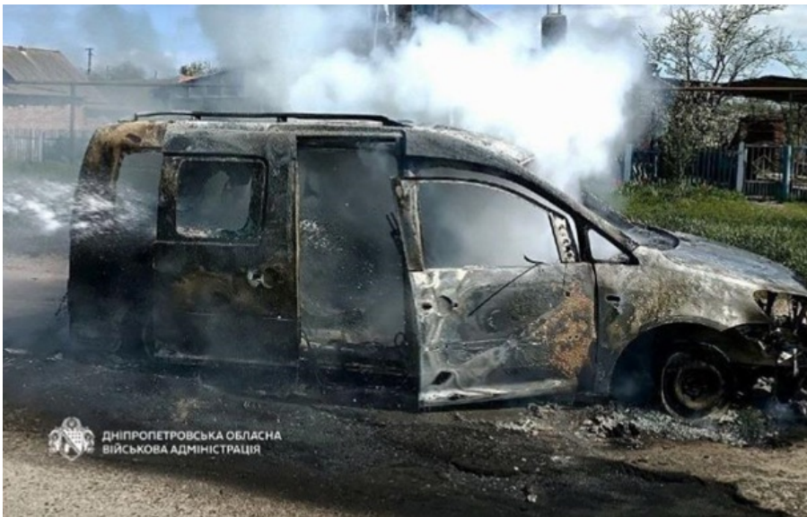
Через удар згоріла автівка

Через удар згоріла автівка. Загинув 72-річний чоловік. Ще один чоловік та жінка постраждали.