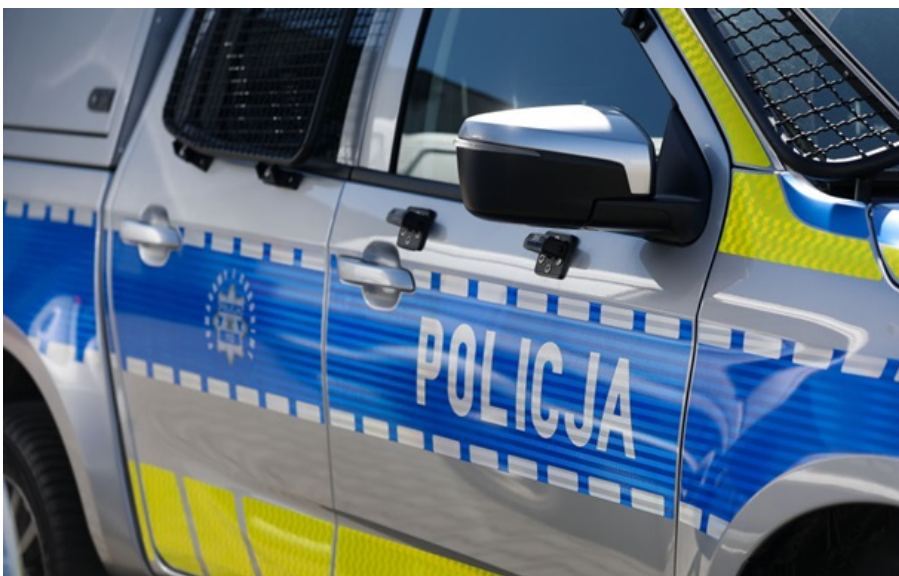
Поліція Польщі розслідує колективне знущання над українськими підлітками

Поліцейські польського міста Ольштин встановлюють перебіг подій та особи всіх учасників злочину.