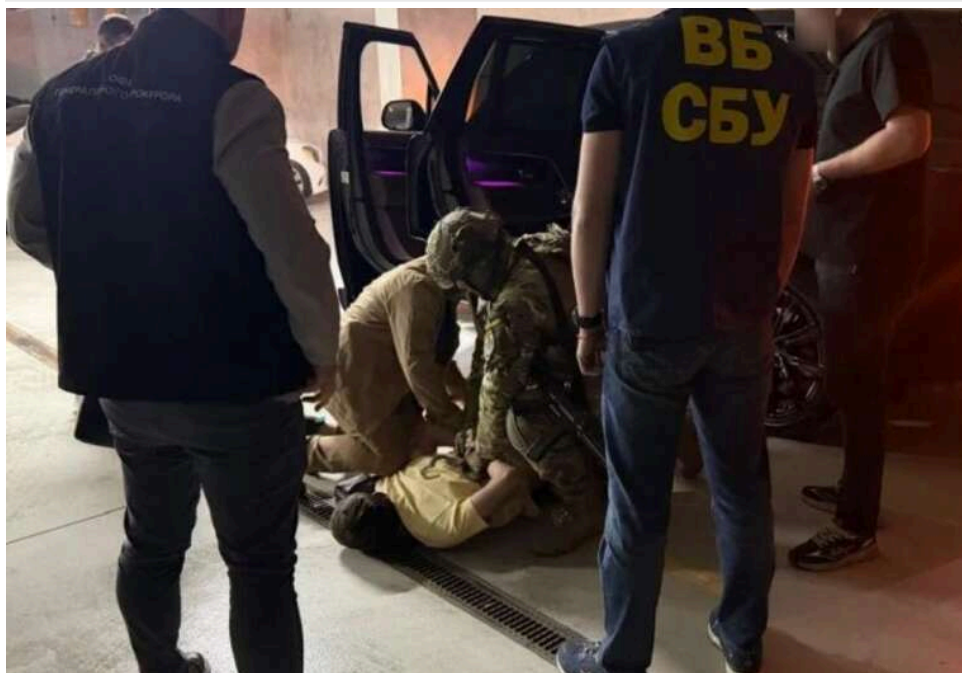
Затримання на гарячому: співробітник СБУ «погорів» на хабарі у 34 тисячі доларів

Працівника СБУ затримали на хабарі у 34 тисячі доларів США.