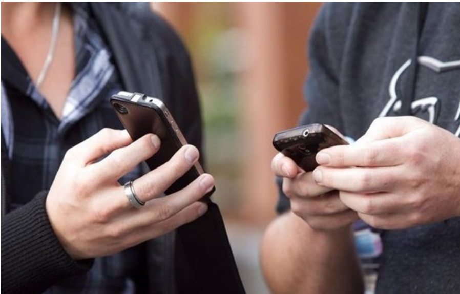
Фото: Вчасно (ілюстративне фото)

Україна демонструє низькі європейського рейтингу інтернет-свободи