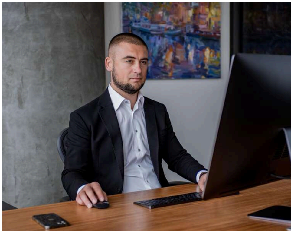
Конвеєр Пулі: як конвертцентр "Термінал-П" викачував бюджетні мільйони через фіктивні фірми

«Постачання на папері»: як конвертцентр Пулі крутив бюджет і навіть дотягнувся до оборонки.