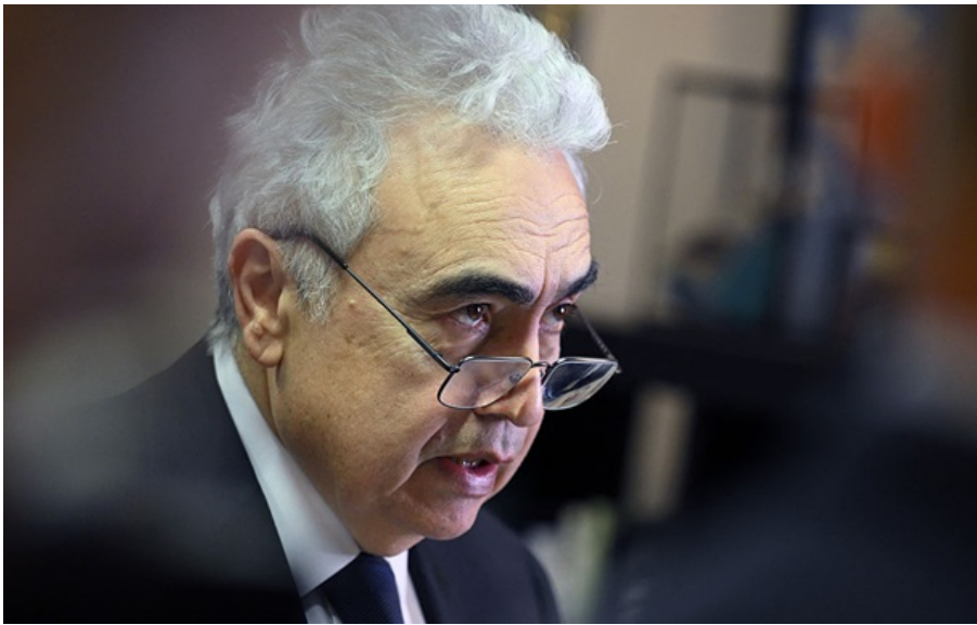
Фатіх Бірол

Відкриття Ормузької протоки не стане панацеєю для глобального енергетичного ринку, попередив глава МЕА Бірол.