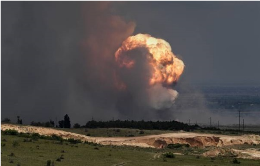
(ілюстративне фото) Багато вибухів у районі аеродромів Бельбек і Кача

Потужний приліт зафіксовано в районі аеродрому на мисі Херсонес, пише Telegram-канал Крымский ветер.