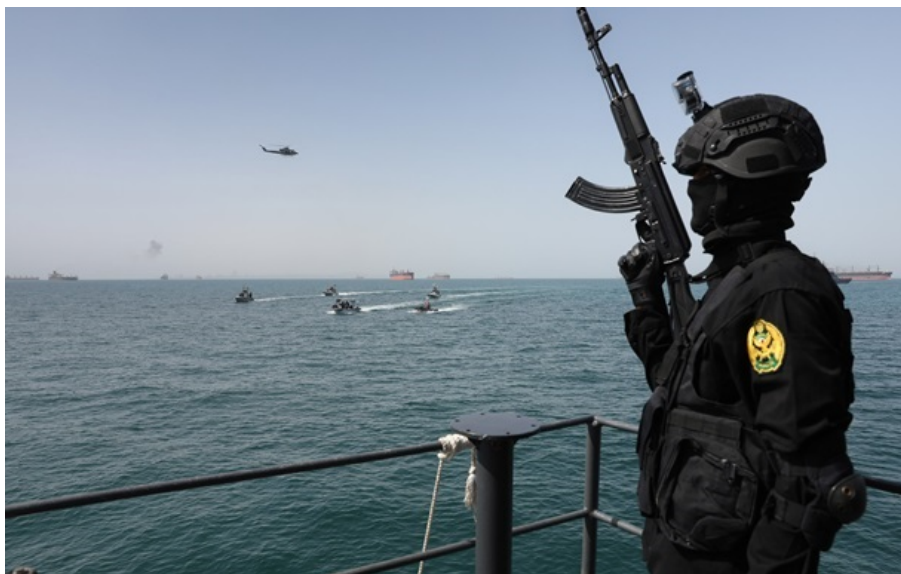
Іран вимагає репарацій за відкриття Ормузької протоки

Тегеран заявив, що повністю відкриє Ормузьку протоку лише після того, як йому компенсують фінансові збитки, завдані війною.