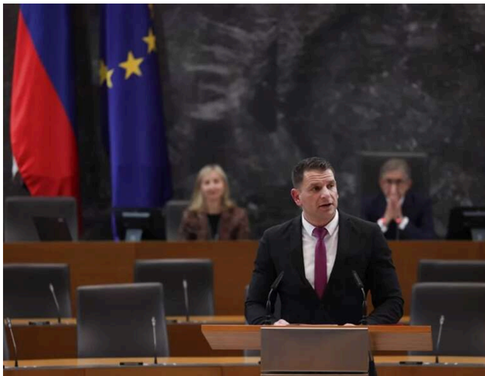
Курс на Кремль: голова парламенту Словенії планує візит до Москви та "будівництво мостів" із РФ

Словенія може кардинально змінити зовнішню політику – аж до виходу з НАТО. У парламенті Словенії заговорили про можливість винесення цього питання на референдум.