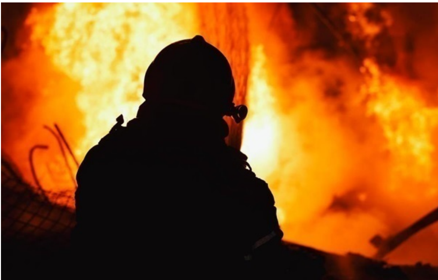
Фото: ДСНС (ілюстративне фото) Росіяни атакували заклад освіти в Семенівці