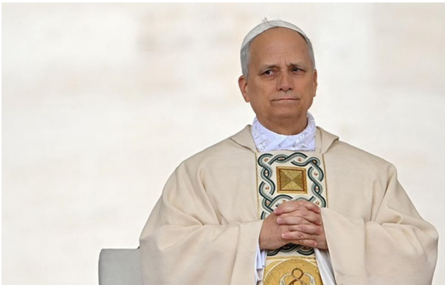
Папа Римський Лев XIV

Лев XIV, який протягом більшої частини свого першого року на чолі Церкви з 1,4 мільярда вірян залишався переважно в тіні, став палким критиком війни в Ірані.