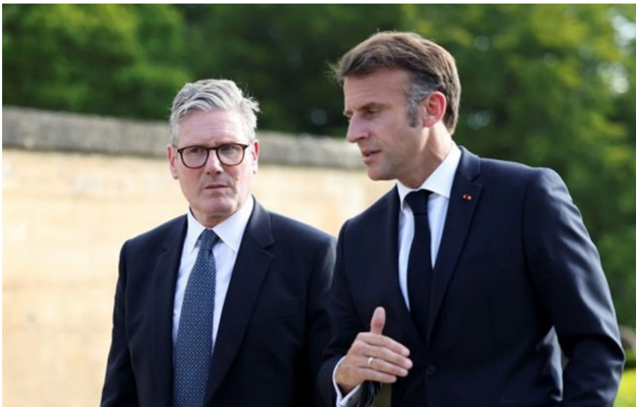
Прем'єр-міністр Великої Британії Кір Стармер та президент Франції Еммануель Макрон