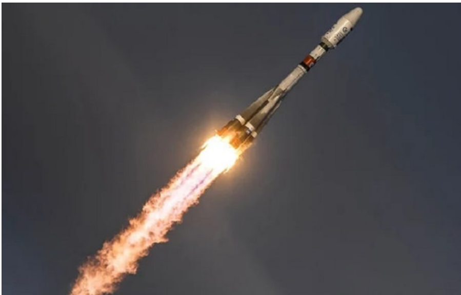
Фото: РосЗМІ РФ заявила про успішний запуск ракети "Союз-2.16"