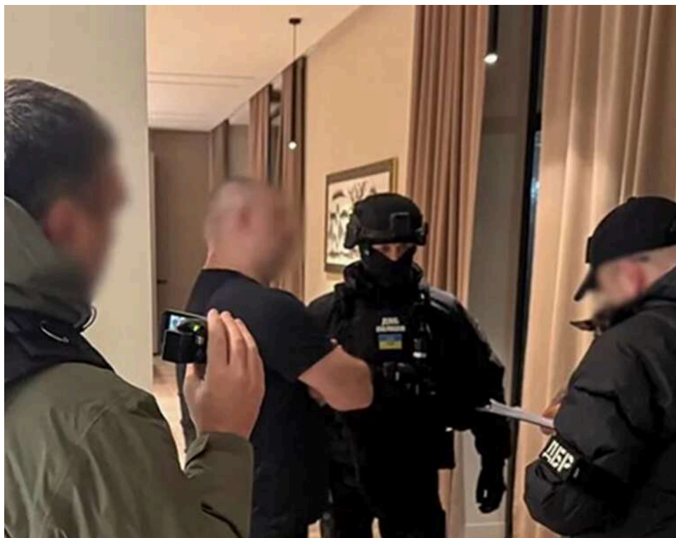
Інсценував смерть, щоб грабувати на мільйони: на Закарпатті затримали хакера, якого шукало ФБР

Українські правоохоронці у співпраці з Федеральним бюро розслідувань (ФБР) затримали на Закарпатті учасника міжнародного кіберсиндикату, який перебував у розшуку в США. Зловмисник ошукав американських та європейських громадян та установи на понад $100 млн, а для уникнення покарання інсценував власну смерть і жив під чужим ім'ям.