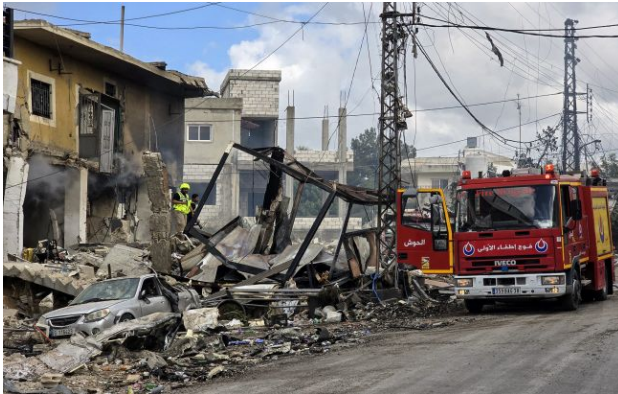
Фото: переговори між США та Іраном можуть затягнутися

Узгодження мирної угоди між США та Іраном може тривати близько шести місяців, що потребує продовження поточного режиму припинення вогню.