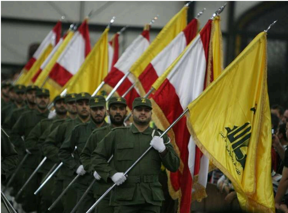
Ізраїль заперечує чутки про тижневий перемир'я з «Хезболлою», що нібито стартує сьогодні

З'явилися чутки про можливе тижневий перемир'я в Лівані, де тривають бої між Ізраїлем та «Хезболлою», сьогодні з півночі.