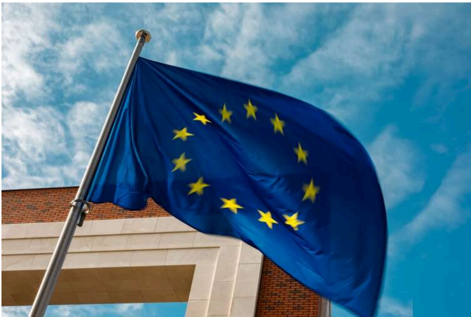
Дистанційна робота та дешевий транспорт: як Єврокомісія планує боротися з енергокризою

Єврокомісія планує рекомендувати щонайменше один день дистанційної роботи на тиждень для працівників і зниження тарифів на громадський транспорт для зменшення витрат пального на тлі енергокризи.