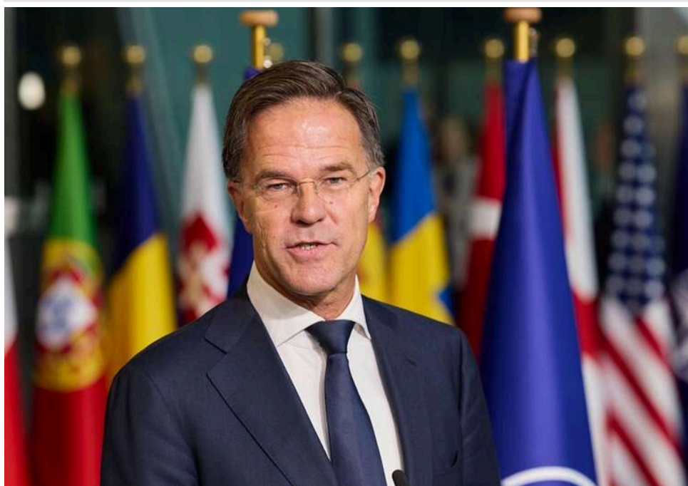
Країни НАТО у 2026 році планують надати Україні 60 мільярдів доларів військової допомоги, – Рютте

Країни НАТО у 2026 році виділять Україні військову допомогу на 60 млрд доларів, окрім 90 млрд євро кредиту від ЄС, повідомив генсек НАТО Марк Рютте на початку зустрічі "Рамштайн" у Берліні.