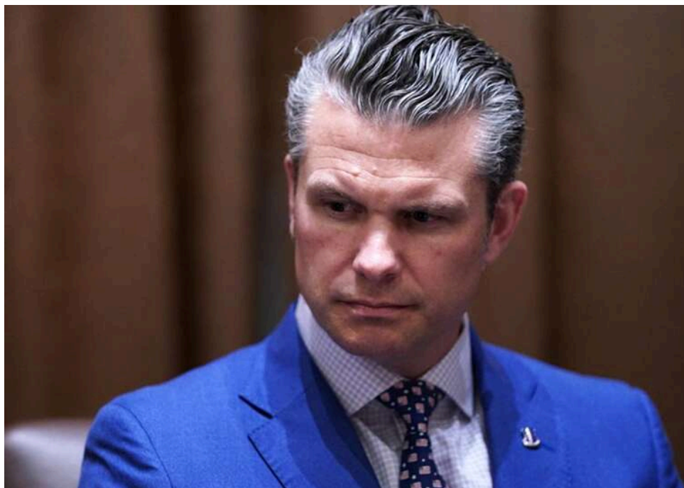
Глава Пентагону знову пропустить зустріч "Рамштайн" щодо України, – Politico

Міністр оборони США Піт Гегсет не візьме участі в зустрічі Контактної групи з питань оборони України, запланованій на цей тиждень. Натомість від США на цій відеоконференції представлятиме країну директор політичного департаменту Пентагону Елбрідж Колбі.