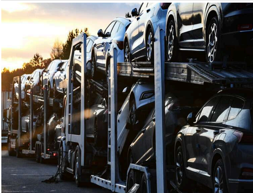
Схема на 5 мільйонів: директора «Корд Авто» оштрафували за підробку польських сертифікатів на імпорт машин